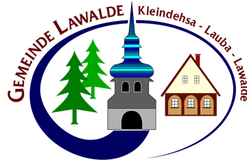
Gemeinde Lawalde Die Bürgermeisterin